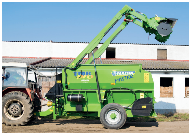
Výkonná fréza s vysokým dosahem