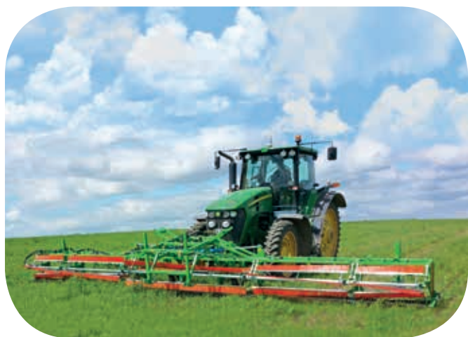
CombCut při likvidaci plevelu na pastvě.