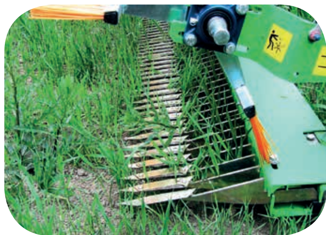
Díky kombinaci ostrého nože a naváděcí špičky dojde k selekci, při níž plodina projde bez poškození a plevel je poškozen či odstraněn.