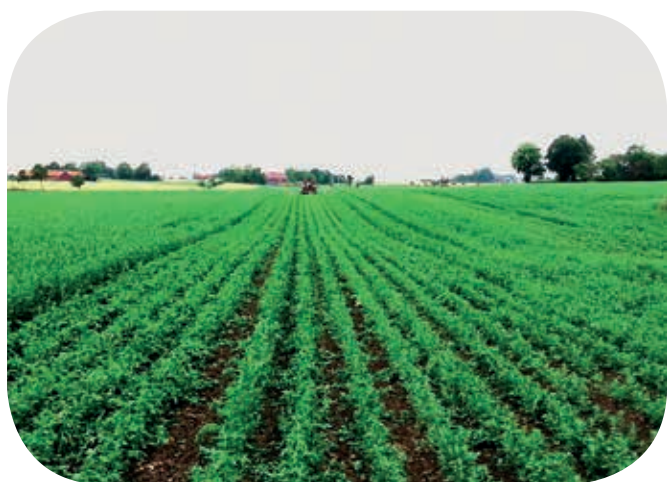
Porovnání porostu zelí před a po přejezdu stroje CombCut.

Se strojem CombCut můžete bojovat s plevely během celé vegetační doby. Doporučujeme začít již na začátku sezóny a poté několikrát opakovat dle potřeby. CombCut je také jediné řešení na likvidaci plevelů, které jsou rezistentní na herbicidy.