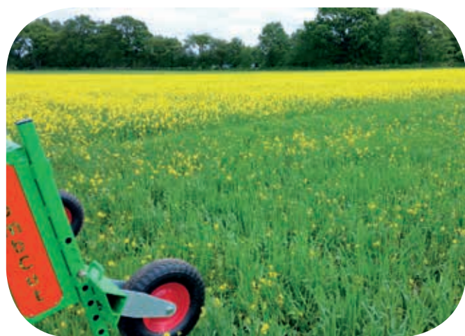
Porovnání porostu obilí před a po odstranění plevelné hořčice.